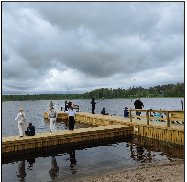
Metsoleirillä oli jälleen ohjelmassa monipuolista kalastus- ja kala-asiaa

Suomen metsästäjäliiton Metsoleiri järjestettiin jälleen kesäkuussa Orimattilan Salusjärven leirikeskuksessa. Viikon leiristä yhden päivän ohjelmaa oli varattu kalateemalle. Katalousalue hankki oman väen lisäksi paikalle Uudenmaan katalouskeskuksen ohjaajan ja Itä-Uudenmaan ja Porvoonjoen vesien- ja ilmansuojeluyhdistyksen vesistötalkkarin. Leirin nuoret jaettiin kolmeen ryhmään ja he kiersivät eri "rasteilla". Yksi rasti käsitteli mm. kalastussääntöjä ja lähialueen kalastoa yleisesti. Myös vaelluskalat olivat uhanalaisuutensa takia keskeinen puheenaihe. Toisella rastilla opetettiin kalojen käsittelyä, perkaamista ja fileointia. Kolmas rasti oli onkiminen. Leirille osallistui yli 70 lasta ja nuorta.