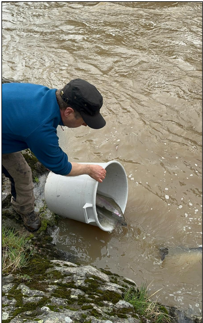
Mustijokeen istutettiin kirjolohia lupatuloista saaduilla varoilla.

Kirjolohia istutettiin lupa-alueen koskista Mäntsälän Lukkokeskeen ja Nummistenkoskeen sekä Pornaisten Karjakoskeen ja Itälänkoskeen. Istutuksia tehtiin suunnitelman mukaisesti neljä kertaa kalastuskauden aikana. Kalat toimitti Kalatalousyhteisöjen liitto ry. Istutuksiin käytettiin 7167,70 € ja muihin lupa-alueen kuluihin, kuten lupalomakkeisiin käytettiin 440,15 €.