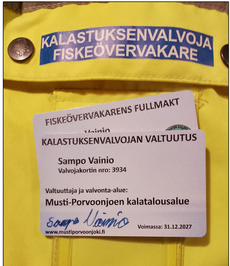
Kalastuksenvalvojille laadittiin ja teetettiin kaksikieliset luottokorttikokoiset ja säätä kestävät valtuutuskortit.

Valvojille laadittiin ja teetettiin kaksikieliset luottokorttikokoiset valtuutuskortit, jotka kestävät kosteutta ja ne voi asettaa näkyville valvontaliiviin. Lisäksi hankittiin uusia tarvikkeita, kuten liivi, valvojahattuja ja kirjallisuutta sekä omalla nimellä ja yhteystiedolla varustettuja lipukkeita, joilla tarkastetut pyydykset merkitään. Valvojille on otettu tapaturmien varalle talkoovuorokaus.