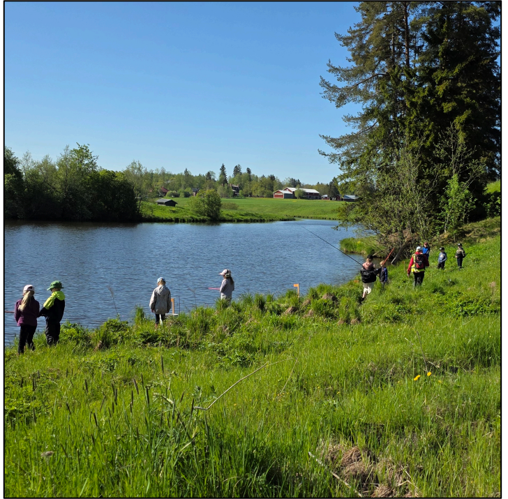
Nummisten koulun onkipäivinä sää suosi ja kalaakin saatiin.

Mäntsälän Nummisten koululla on jo perinteenä toukokuun lopun onkiviikko Mustijoella Nummistenkosken alapuolisella rannalla. Nummisten osakaskunta on laittanut onkisektorit rantaan ja jättänyt onkitarvikkeet kosken laavulle. Katalousalueen talkoolaiset ja vesistötalkkarit kävivät kahtena päivänä ohjaamassa 1.-3. – luokkien oppilaiden onkipäiviä. Tuolloin käytössä oli katalousalueen monipuolisemmat varusteet ja kokoneiden ohjaajien apu.